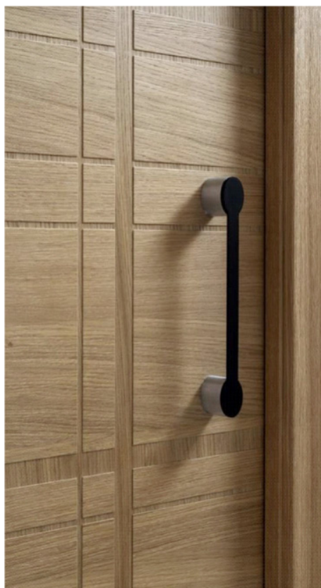
Pannello ART DESIGN pantografato (esempio)