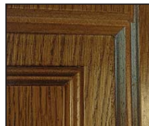
Esempio pannello pantografato e verniciato