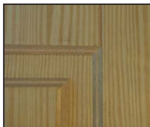
Esempio pannello grezzo pantografato