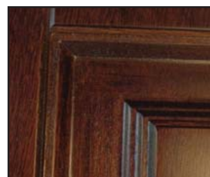
Esempio pannello pantografato e verniciato