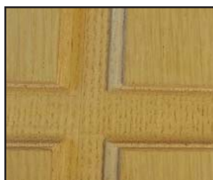
Esempio pannello grezzo pantografato