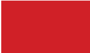
48. Laccato rosso